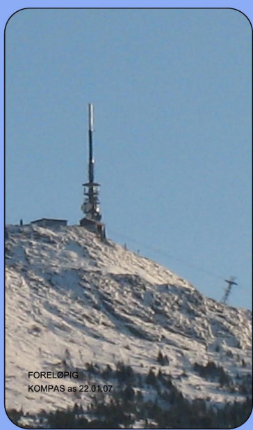
FORELØPIG KOMPASS as 22.01.07