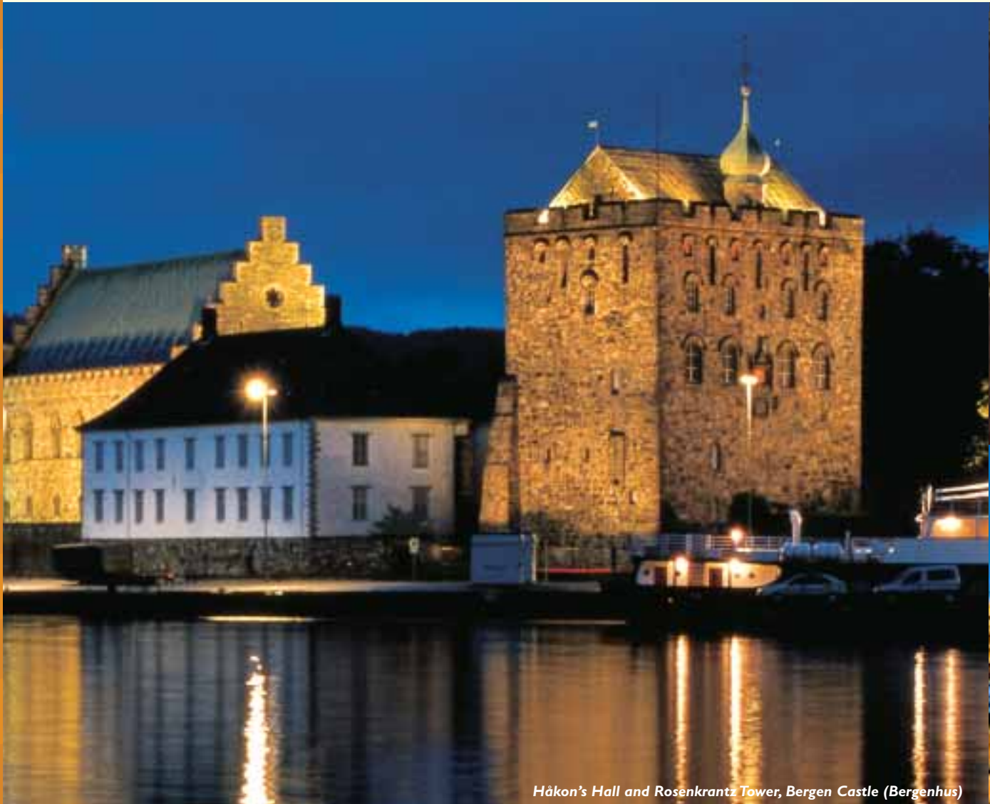
Håkon's Hall and Rosenkrantz Tower, Bergen Castle (Bergenshus)

Bergen ha dado la bienvenida a la gente desde hace más de 900 años