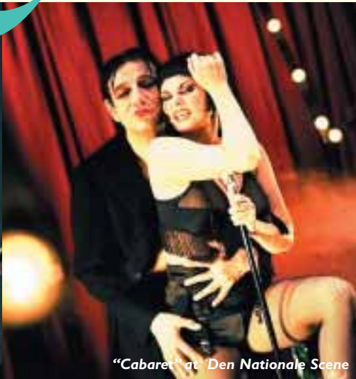
"Cabaret" at Den Nationale Scene