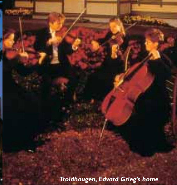
Troldhaugen, Edvard Grieg's home

nórdico, Ludvig Holberg, al primer gran pintor paisajista noruego, Johan Christian Dahl, y al pequeño gran compositor Edvard Grieg. Bien es cierto que el universal dramaturgo Henrik Ibsen no nació aquí pero fue en Bergen donde recibió su bautismo espiritual y donde hizo su primera incursión en el mundo teatral. Tampoco vio la luz en Bergen el pintor Edvard Munch, pero un comerciante de esta ciudad se encargó de adquirir para ella una colección única de sus obras.