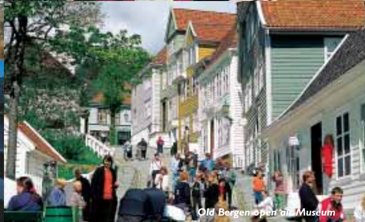
Old Bergen open air Museum

Venga a Bergen en verano, cuando el paisaje brinda todos los matices del verde, el fiordo rebosa de pequeñas embarcaciones y la ciudad se desborda de visitantes. Venga a Bergen en otoño y en invierno, para conocer la lluvia, el viento y la cálida hospitalidad. Venga a Bergen en cualquier época. Aquí siempre ocurre algo indescriptible, siempre hay algo maravilloso que conocer.