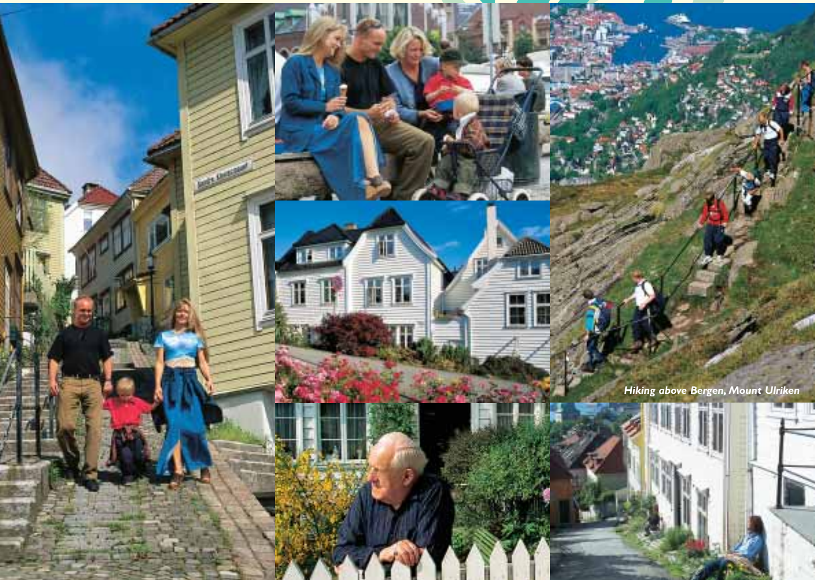
Hiking above Bergen, Mount Ulriken

montañas y comparten el espacio con las casas señoriales que conforman el núcleo urbano, que se apilontonan en viejas manzanas entre los barrios modernos. Los nativos hacen lo imposible por conservar la tradición de los adoquines y la tradición arquitectónica de Bergen, tan característica y variada. A pesar de los numerosos incendios sufridos a lo largo de los siglos, Bergen es todavía una de las ciudades de Europa con mayor cantidad de casas de madera. Por no decir la más importante.