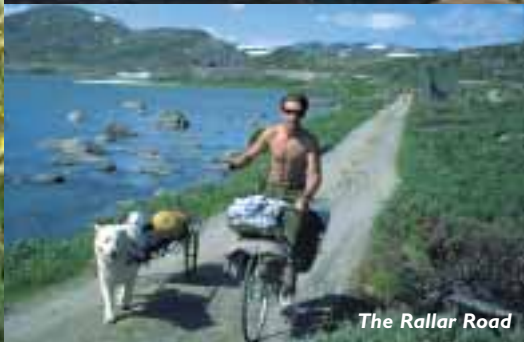
The Rallar Road