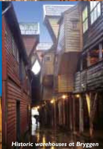
Historic warehouses at Bryggen