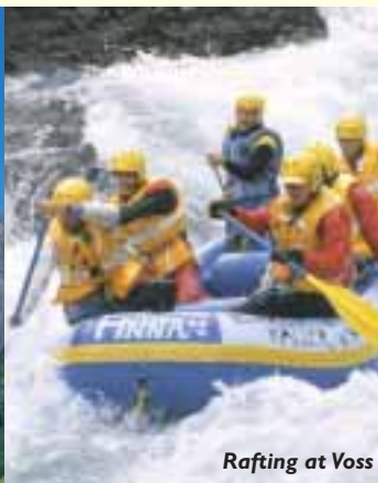
Rafting at Voss