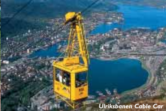
Ulriksbanen Cable Car