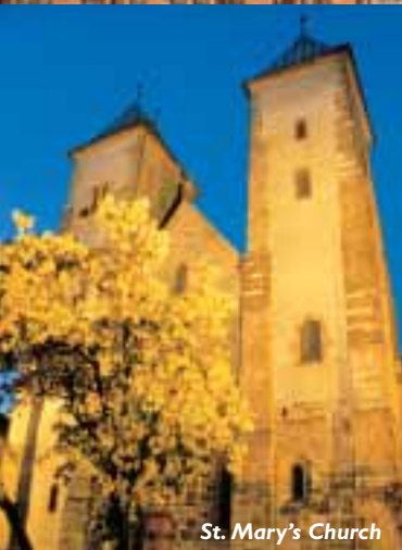
St. Mary's Church