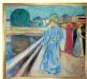
Edvard Munch: Las mujeres en el muelle 1903. Galería de arte, Bergen.

Los antiguos comerciantes de Bergen tenían también una gran sensibilidad por la cultura. Fueron ellos quienes pusieron las bases para que la ciudad comerciante se transformase en ciudad