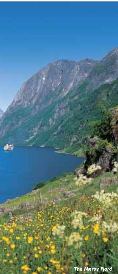
The Nærøy Fjord