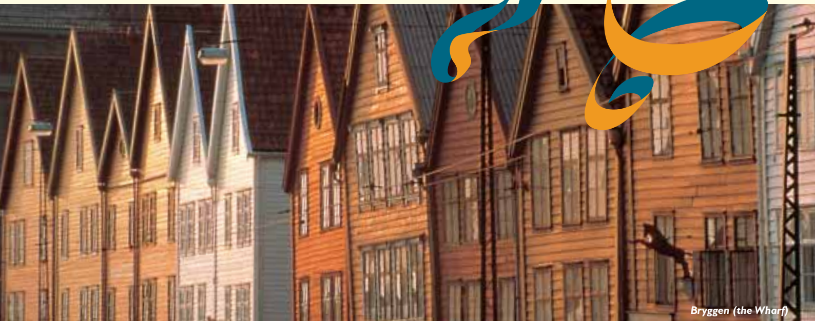
Bryggen (the Wharf)